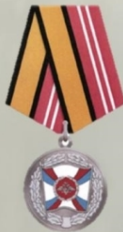
МЕДАЛЬ "ЗА УКРЕПЛЕНИЕ БОЕВОГО СОДРУЖЕСТВА"